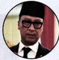
Menteri Perindustrian Dr. Agus Gumiwang Kartasasmita, M.Si*