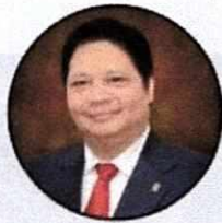
Menko Ekonomi Dr. (HC). Ir. Airlangga Hartanto, MMT, MBA, IPU*

Membangun Optimisme, Menghadapi Peluang dan Tantangan untuk Mencapai Pertumbuhan Di Atas 5% Dengan Menjadikan Sektor Industri Sebagai Leading Sector