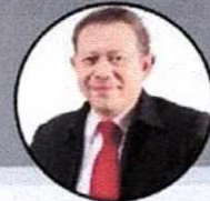
I Made Dana Tangkas, IPU, ASEAN, Eng Ketua BKTI PII - Presiden IOI - Kadin Bidang Industri