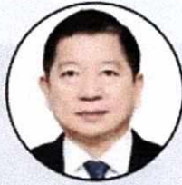
Menteri Perencanaan Pembangunan Nasional Dr. Ir. H. Suharso Monoarfa